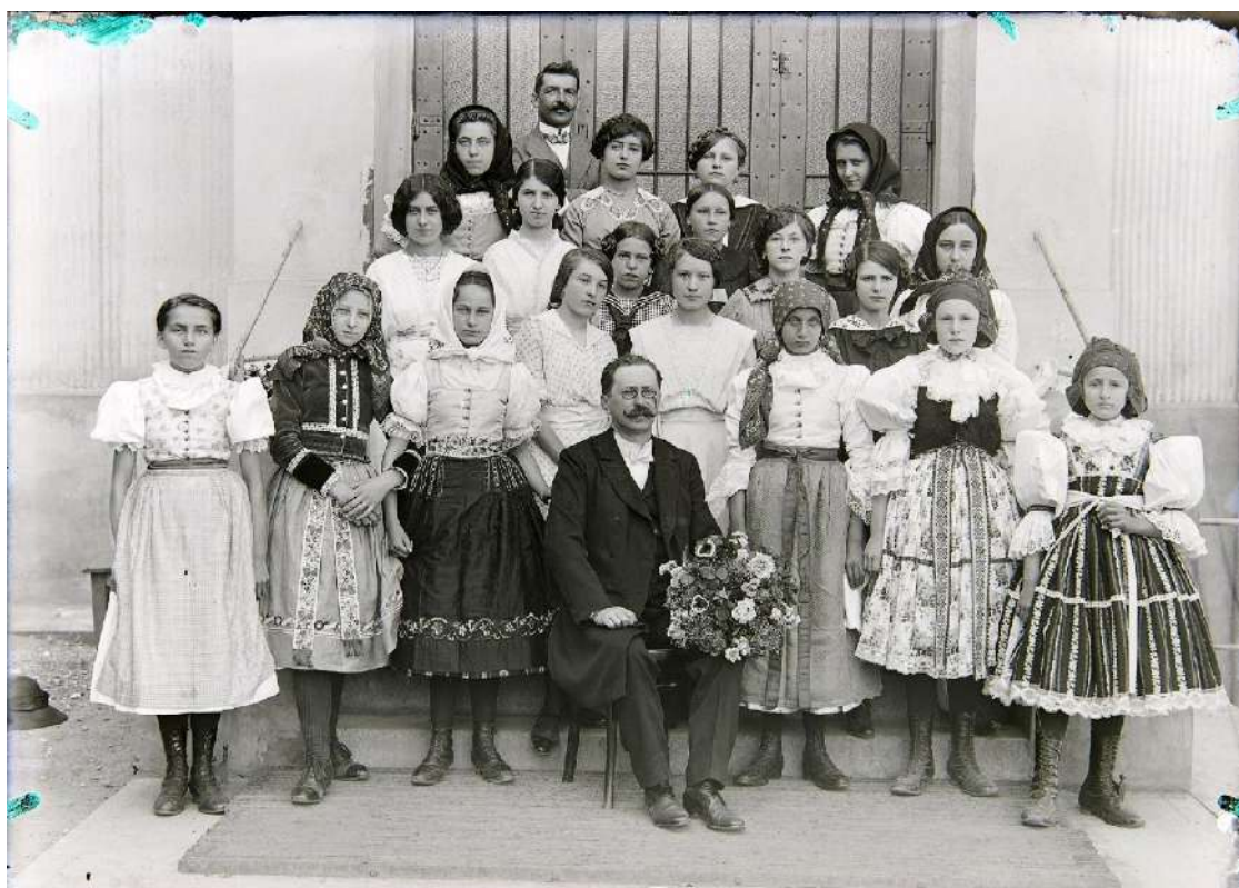
Dívčí škola ve Strážnici, 1919

Historické fotografie (můžete je využít k práci s žáky)