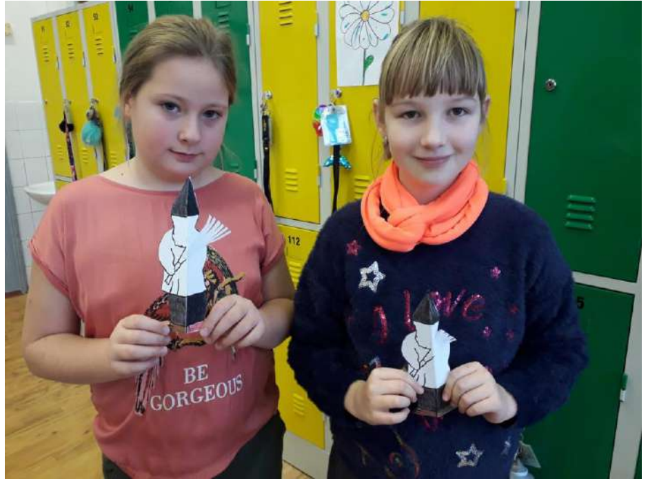
V Dolní Rožince při tříkrálovém věštění z hrnečků propojili práci tříd ZŠ a mateřské školy.