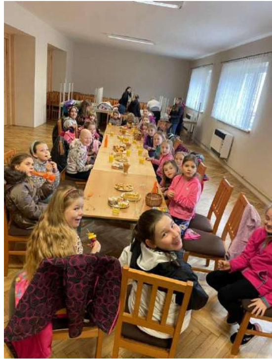
Výprava se smrtkou proběhla také v Doubravníku.