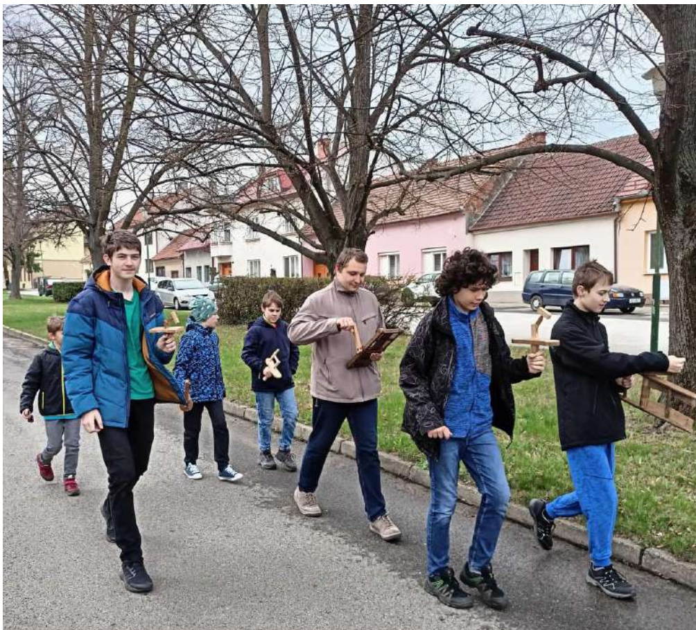
Tradiční seřazení hrkačů – od nejstarších po nejmladší